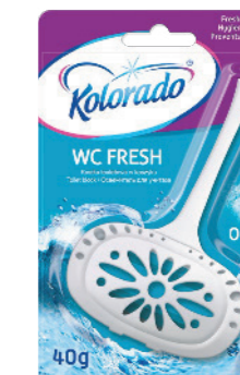
● Morski Ocean / Морской