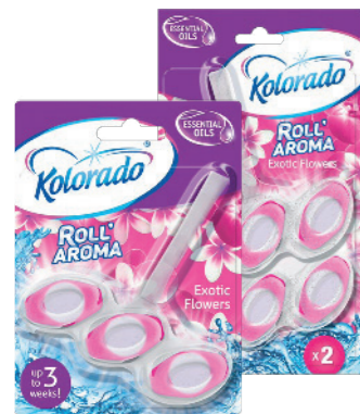
● Exotic Flowers