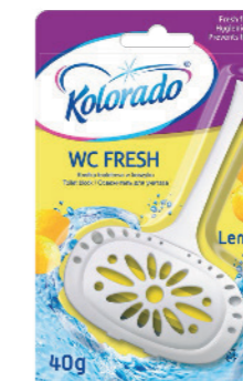
● Cytrynowy Lemon / Лимон