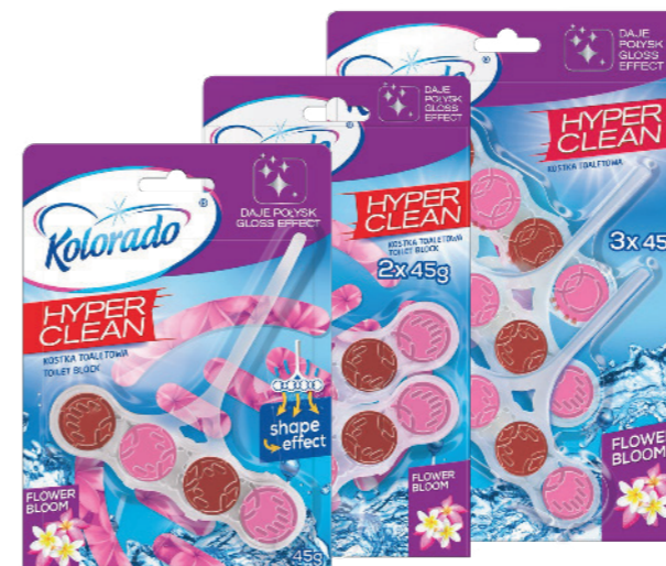
● Flower Bloom

Компания HAL является польским семейным предприятием, основанным в 1991 году, ведущей производство туалетных блоков, таблеток для бачка унитаза, гелевых освежителей, кухонных губок и губок для тела. Благодаря современному парку оборудования, лаборатории и опытному персоналу, предлагает конкурентоспособные и инновационные продукты Private Label и успешно конкурирует с растущей конкуренцией на внутреннем и внешнем рынке. Чтобы удовлетворить ожидания клиентов Private Label, HAL внедрил систему управления качеством, основанную на стандарте BRC Consumer Products и ежегодно получаем положительную оценку сертификационного аудита. Для наших клиентов становится это безопасностью и вероятностью что наши продукты соответствуют самым высоким требованиям.