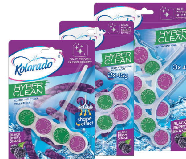
● Blackberry Shake