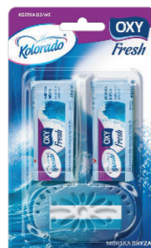
● Morski Ocean / Морской