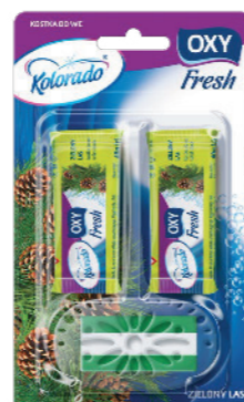
● Zielony las / Green forest / Зеленый лес