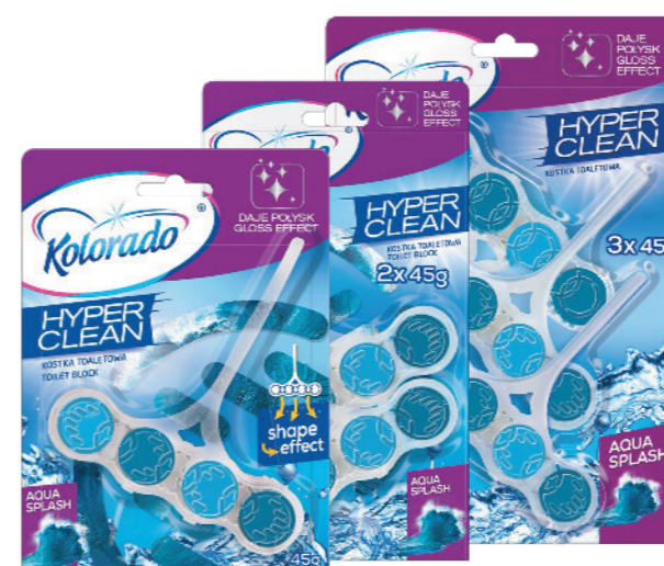
● Aqua Splash