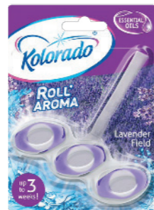
● Lavender Field