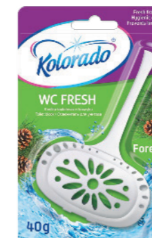
● Leśny Forest / Сосна