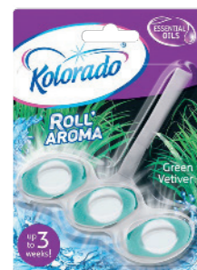
● Green Vetiver