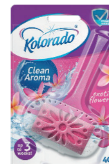
● Exotic Flowers