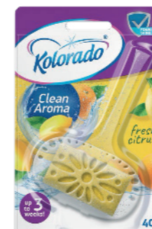
● Fresh Citrus