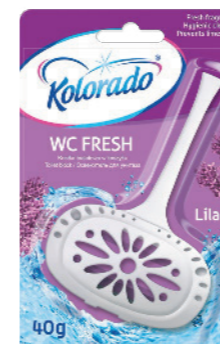
● Kwiat bzu Lilac / Сирень

BEZ FOSFORANÓW BEZ FOSFORANÓW PHOSPHATE FREE