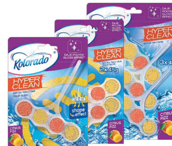
● Citrus Fizz