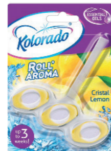
● Cristal Lemon