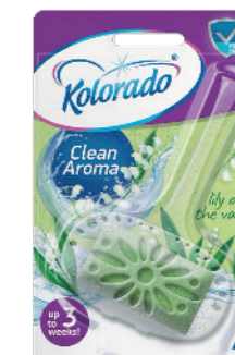
● Lily of the Valley