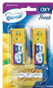
● Cytrynowy Lemon / Лимон