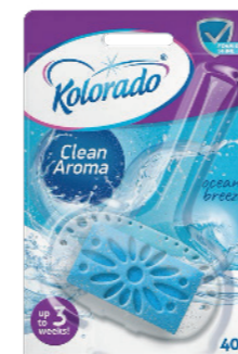
● Ocean Breeze

RU трехфазный блок для туалета в классическом контейнере; активное содержание кислорода дает отбеливающий эффект; обеспечивает защиту от микробов и образует активную пену; предотвращает образование налета; классические ароматы; активный до 3 недель в упаковке 1 подвеска + 3 запаски