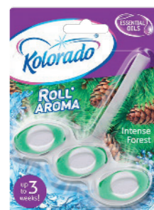
● Intense Forest

PL designerski, bezbarwny koszyk; 3 osobne kostki działają wyjątkowo efektywnie; działanie wybielające dzięki zawartości aktywnego tlenu; zapobiega osadzaniu się kamienia; czyści i nadaje blask; obfita piana dzięki specjalistycznemu składnikowi; wyjątkowo mocny i trwały zapach dzięki olejkom eterycznym; działa do 3 tygodni