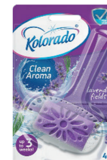
● Lavender Fields