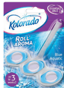
● Blue Aquatic